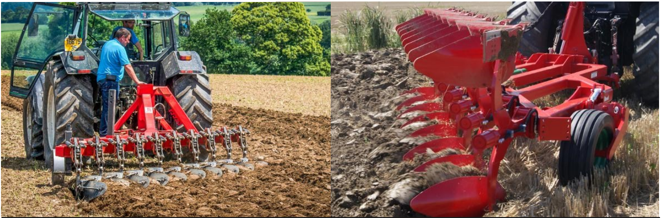
Charrue déchaumeuse Bugnot et Ovlac