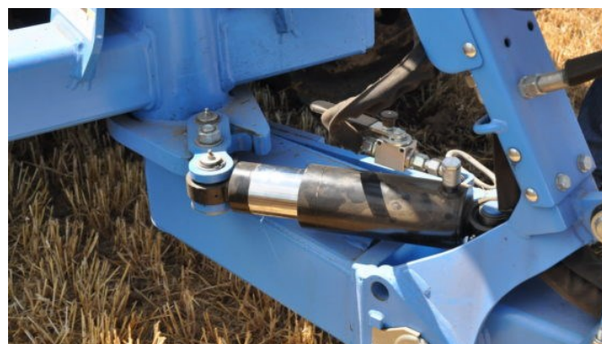
Vérin supplémentaire du système OptiLine

Présentée à l'Agritechnica, ce système novateur est proposé depuis la fin de l'été 2018 et s'adresse à tous les agriculteurs souhaitant acquérir une charrue semi-portée afin de bénéficier de cet avantage.